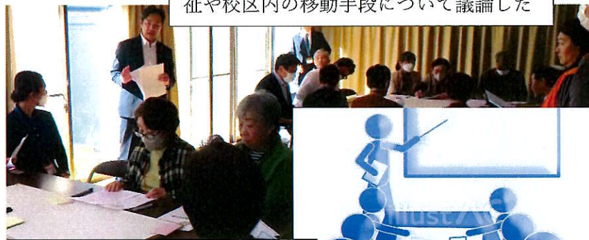
社協の地域懇談会、5~6年先に向けて福祉や校区内の移動手段について議論した