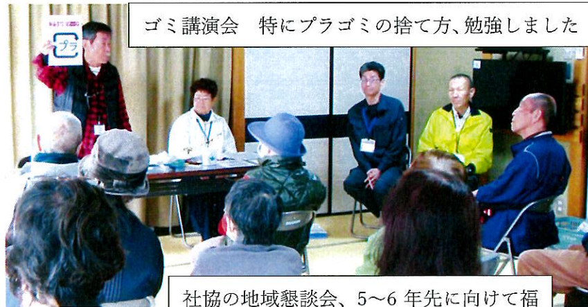
ゴミ講演会 特にプラゴミの捨て方、勉強しました