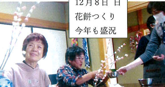
12月8日 日 花餅つくり 今年も盛況