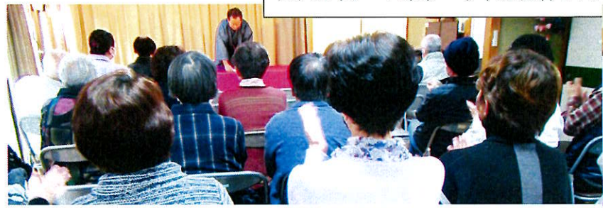
大入り南コミ寄席 今年は演者4人