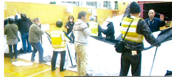
夜間防災訓練 間仕切り テントと本物トイレ対応