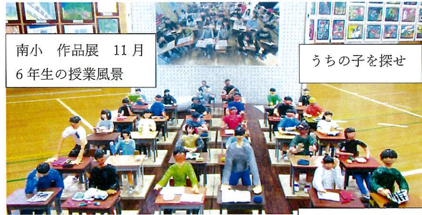
南小 作品展 11月 6年生の授業風景