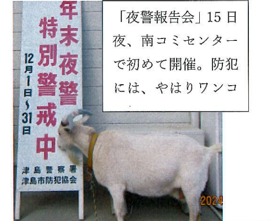
「夜警報告会」15日 夜、南コミセンター で初めて開催。防犯 には、やはりワンコ