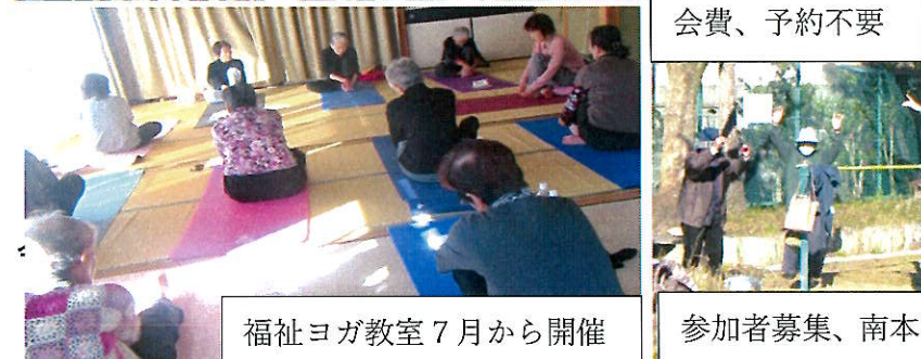
福祉ヨガ教室7月から開催