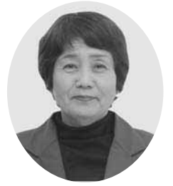
日本共産党議員団 伊藤恵子