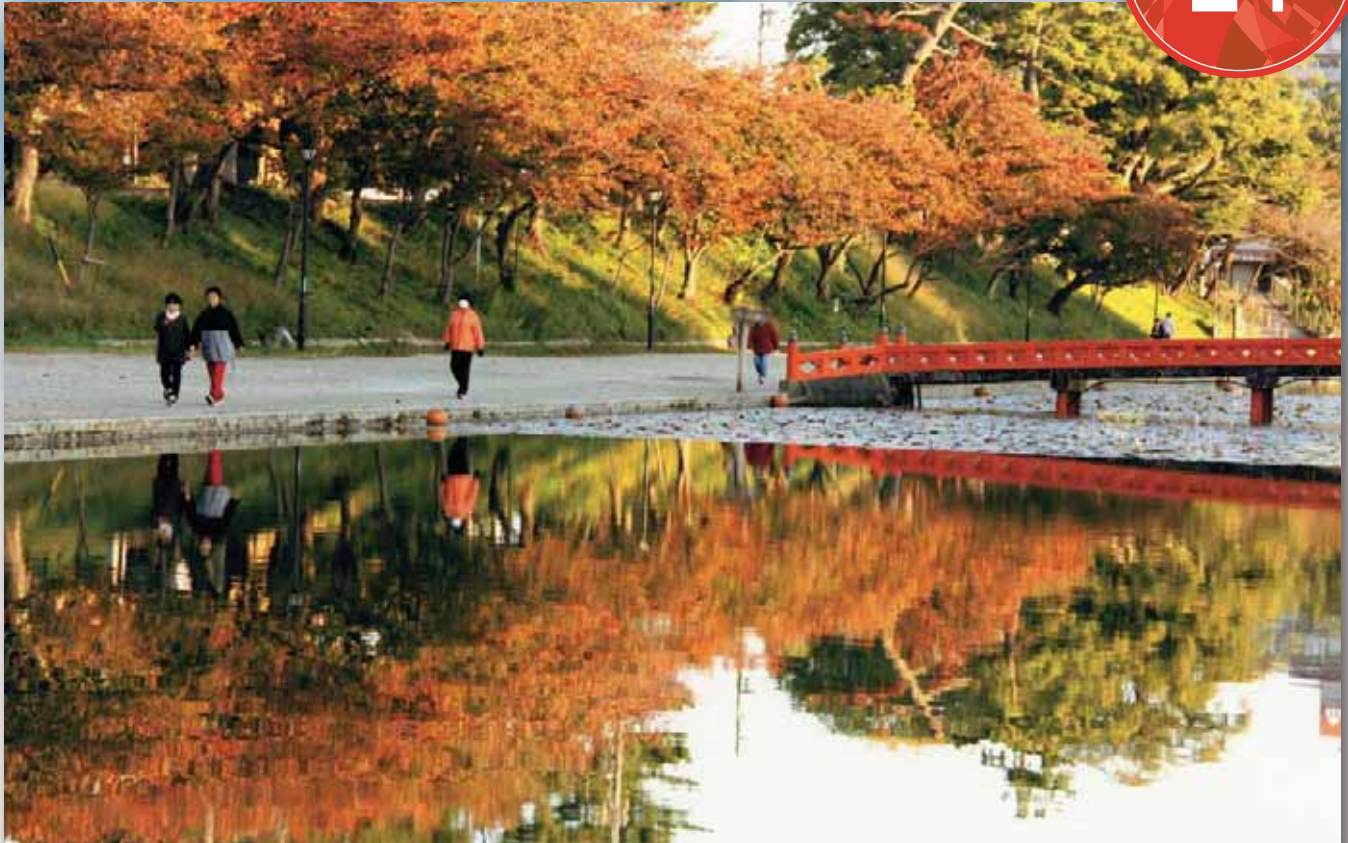
↑天王川公園の紅葉

※議会だよりは、3月・6月・9月・12月の年4回の定例会、また、必要に応じて開催される臨時会の内容を中心に編集しており、2月・5月・8月・11月に発行します。