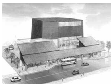
▲まつり会館のイメージ画(外観)

まちづくりは、1年2年でできるものではない。10年20年かかるものなので、私の思いで、市民の意見を聞きながら、まつり会館建設という夢をかなえていきたい。その感覚である。