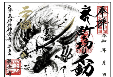
観音寺の絵付御朱印