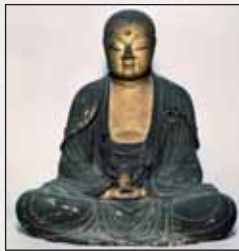
木造地藏菩薩坐像