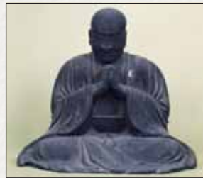
木造一向上人坐像 (文明二年在銘)