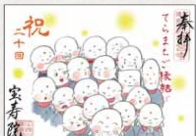
※詳細は宝寿院のInstagram (@houjuuin.yakushi) をご確認ください。