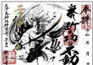
※詳細は観音寺のX(Twitter) (@kannonji81) をご確認ください。