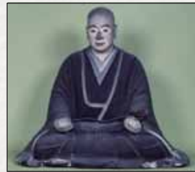
木造弥阿上人坐像 (貞和三年在銘)