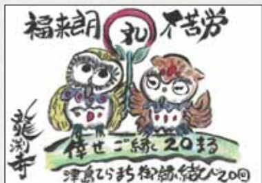
※詳細は龍淵寺のInstagram (@ryuenji_ojizousama) をご確認ください。