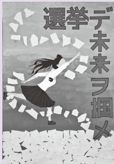
おおわきうみ 大脇有未 (津島高1年)