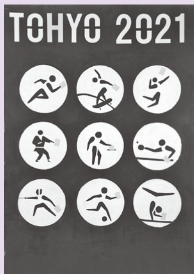
たかぎもえ 高木萌愛 (津島高1年)