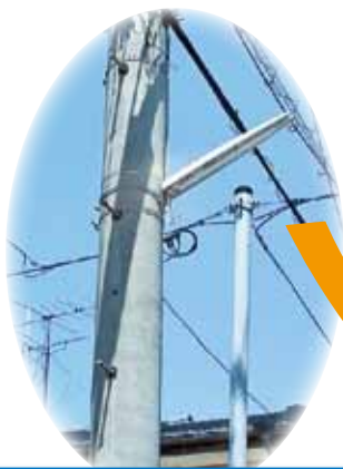
水銀灯・蛍光灯の防犯灯