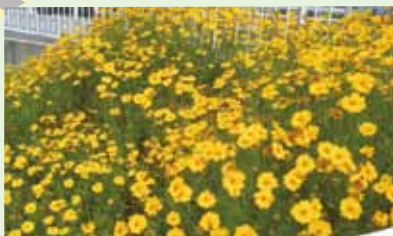
▲オオキンケイギクの花

これらの外来植物は繁殖力が強く、ひとたび大繁殖してしまうと根絶が難しくなります。庭などで見つけた際は駆除にご協力ください。詳しくは市ホームページをご覧ください。