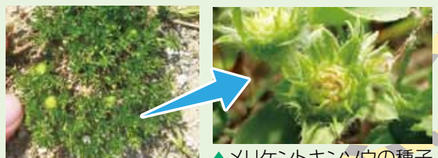
▲メリケントキンソウの種子

4～7月ごろに鋭いトゲのある種子を付ける一年草です。高さは5cm程度で日当たりのよい場所で繁殖します。トゲに毒はありませんが、刺さって怪我をしたり、靴底に刺さって運ばれると分布が拡大してしまいます。