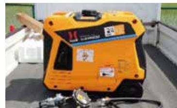
インバータ発電機▶