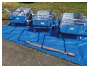
▲折りたたみリヤカー

西小学校区コミュニティ推進協議会では、空気清浄機、備品物置、ポータブル電源・ソーラーパネルセットほか11品を、高台寺小学校区コミュニティ推進協議会では、インバータ発電機、ワンタッチテント、パソコンほか20品を、この助成金で整備しました。