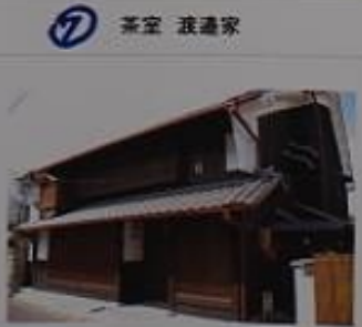
7 茶室 渡邊家 尾張津島天王祭の車屋を担う渡邊家は種児門のある町家。一階に茶室があり、二階にも遠州好みの風合いのある活月楼という茶室がある。