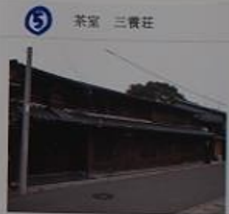
5 茶室 三善荘 町家建築。一雨軒という茶室がある。 宝泉寺の書院と双子の書院(バカリ)両方根柢もあつよ!