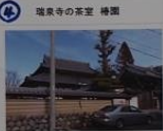
4 瑞泉寺の茶室 掃園 浄土宗西山禅林寺派。良王君ゆかりの寺にある茶室。 津島神社の神主に於ては、お茶室も公開している模様。