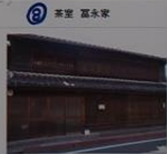
8 茶室 富永家 豪華な茶室があると聞く。