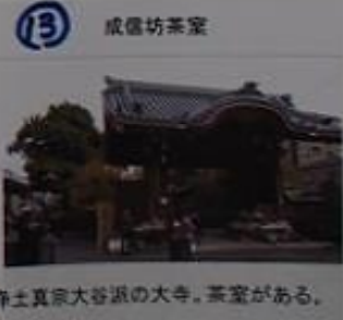
13 成徳坊茶室 浄土真宗大谷派の大本寺。茶室がある。