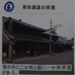
6 長珍酒造の茶室 家の中に二か所と庭に一か所茶室がある。