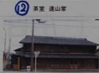
12 茶室 通山家 米之庄の町家。松濤庵という、京都の曼珠院にある八窓軒茶屋の写しとされる茶室がある。