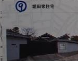
9 堀田家住宅 江戸時代の町家建築を伝える。久田宗参設計の茶室。庭がある。