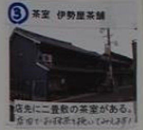
3 茶室 伊勢屋茶舗 店先に二畳敷の茶室がある。 お茶やお抹茶も売っています!