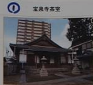
1 宝泉寺茶室 旧服部家書院。国の登録有形文化財。種家の服部家から昭和5年に寄贈(移築)されたもの。服部家では後年この書院の写しを再建。双子の書院と呼ばれている。 松尾流の設計の庭園もあり。