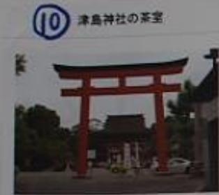
10 津島神社の茶室 津島神社参集所にある茶室。拝観可能かは要交渉。伊藤才兵衛さんが寄贈された茶室。